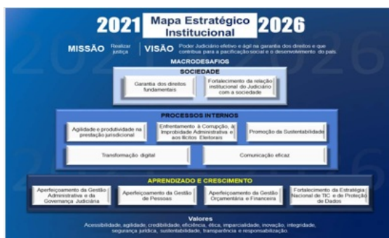
Figura 2 – Mapa Estratégico Institucional

Com base na Estratégia Nacional do Poder Judiciário de que trata a Resolução CNJ n.º 325, de 30.06.2020 foi instituído o Plano Estratégico 2021-2026 da Justiça Eleitoral de Rondônia, por meio da Resolução TRE-RO n.º 8/2021, conforme mapa apresentado abaixo: